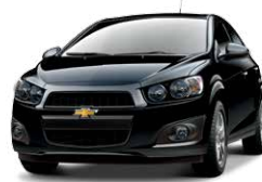
Carbón Flash Metálico